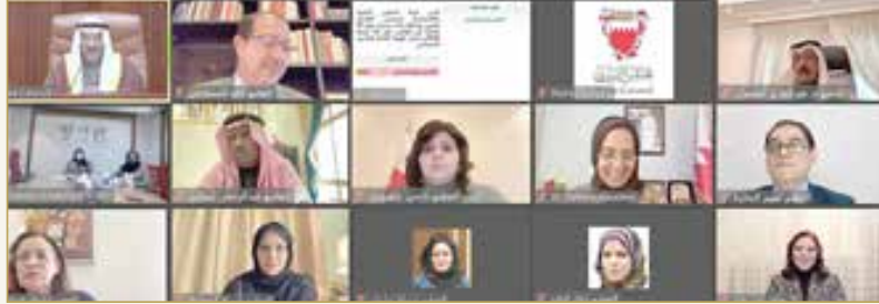
الصورة المنشورة مع التغطية للمشاركين عن بعد