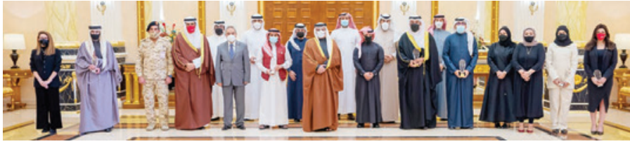
○ سمو ولي العهد رئيس مجلس الوزراء خلال تكريم أصحاب الأفكار الفائزة في مسابقة الابتكار الحكومي.