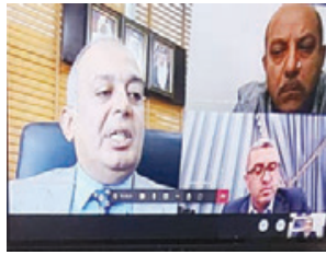
○ جانب من جلسة المناقشة.